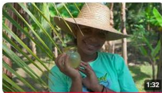
Mujeres jóvenes que transforman el coco y el territorio.