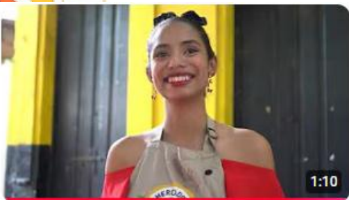
Café, territorio y juventud: Santa Marta